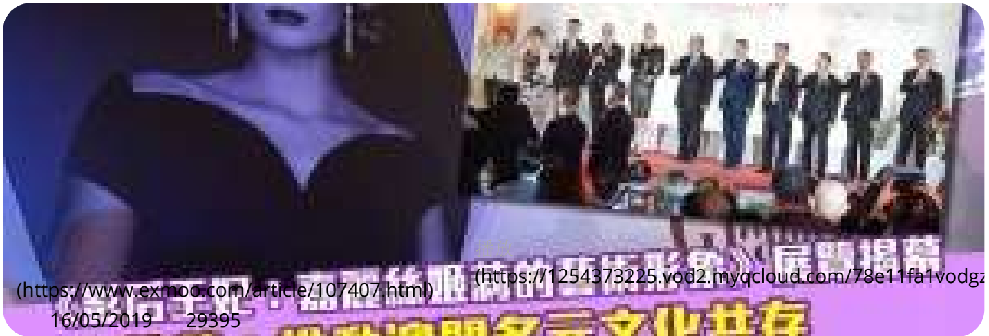
( https://www.exmoo.com/article/107407.html )