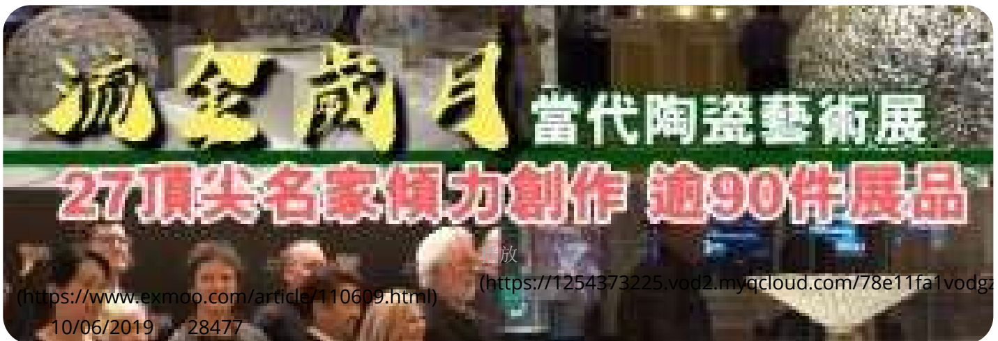
( https://www.exmoo.com/article/110609.html )