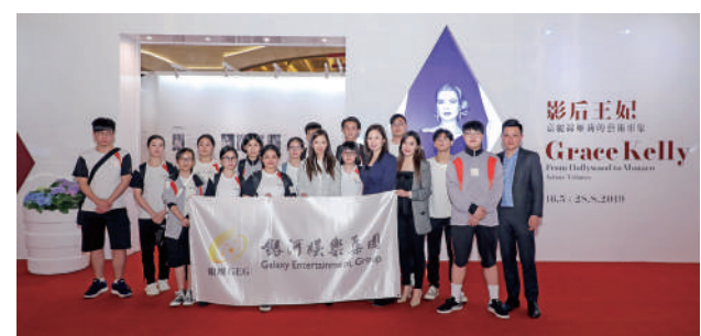
▶ 銀娛邀請本澳不同的社團機構以至多間學校的師生參觀展覽。